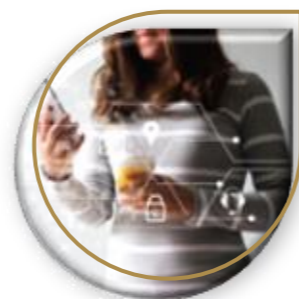
Cobertura (informalidad, mujeres, rurales)