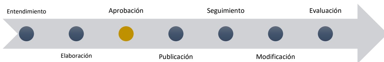
Figura No. 1. Fases institucionales para la estrategia de relación con el ciudadano.

A continuación, se presenta un esquema con las pautas que deben seguirse para la elaboración, ejecución, seguimiento y evaluación de la estrategia de relación con el ciudadano.