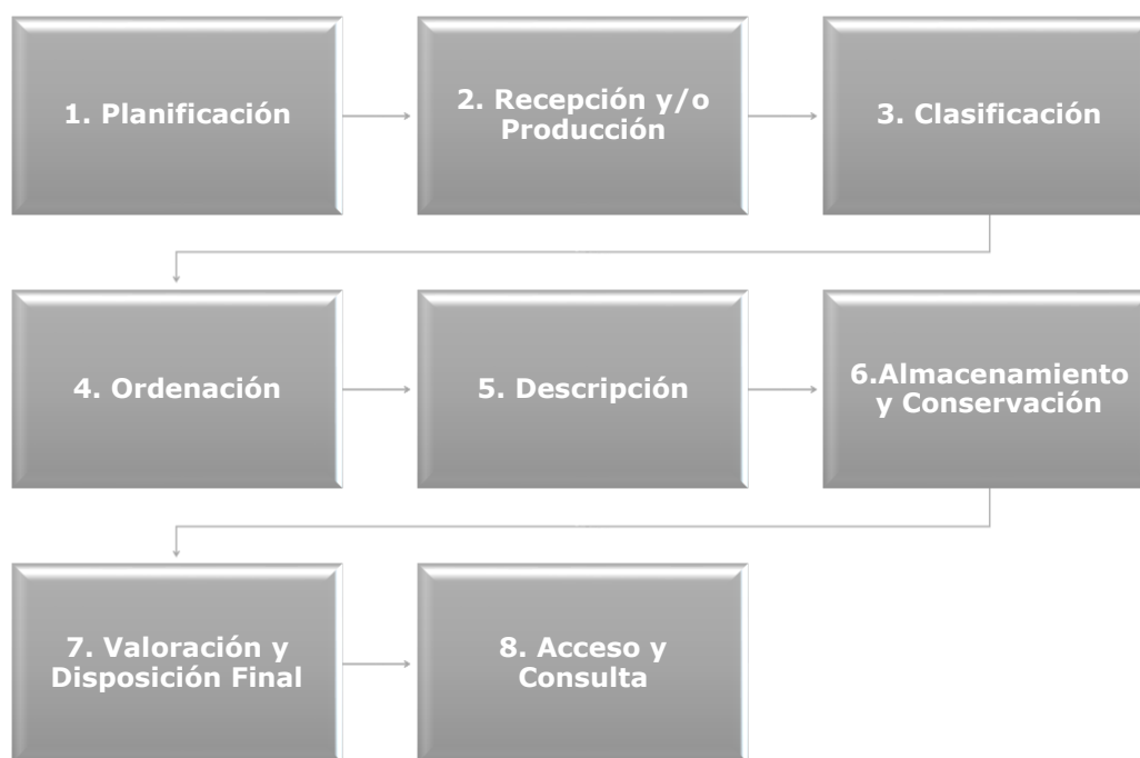
Ilustración 2. Etapas para la organización